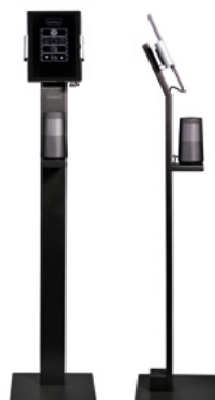
Wellness Coach Social