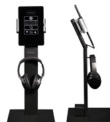
Wellness Coach Personal